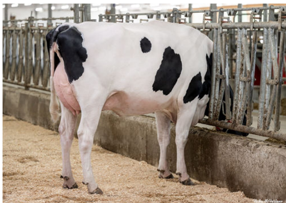
CLAYNOOK MAYLENE KOUFAX DAUGHTER