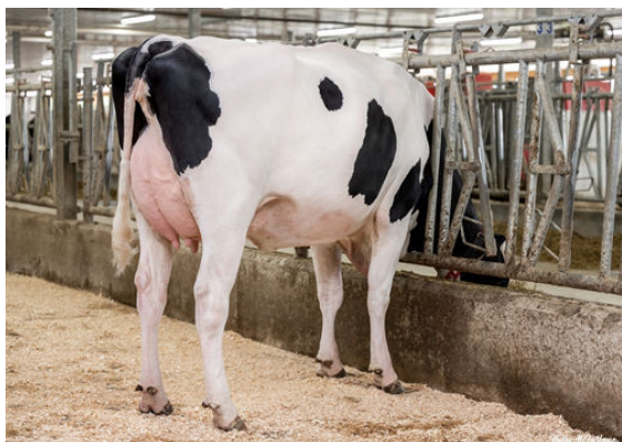
CLAYNOOK MAYLENE KOUFAX DAUGHTER